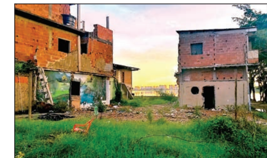
Cerca de 700 casas foram demolidas na Vila Autódromo para dar lugar à Vila Olímpica